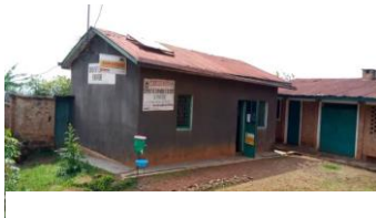
Figure 3 Bureau de la COOPEC NYANTENDE au Sud Kivu :

Un délégué de la COOPEC NYANTENDE avait pris part à cet atelier.