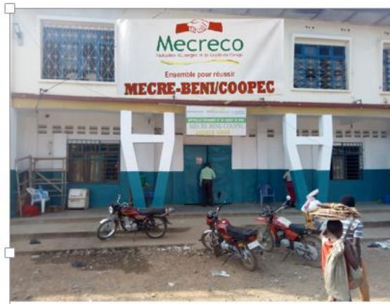
Figure 5 Siège de la MECRE BENI à Beni

Appui aux COOPEC dans l'analyse et l'interprétation des indicateurs de performances