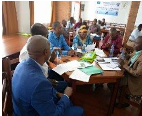
Photo 3 : Délégués des COOPEC membres en groupes de travail lors de l'atelier sur les normes universelles de performances sociales à Goma, le 24 aout 2019

Les membres de l'APROCEC ont suivi la formation sur le genre et inclusion financière en marge de l'Assemblée Générale tenue à Goma le 23 aout 2019. Trente quatre personnes y ont pris part dont 4 femmes.