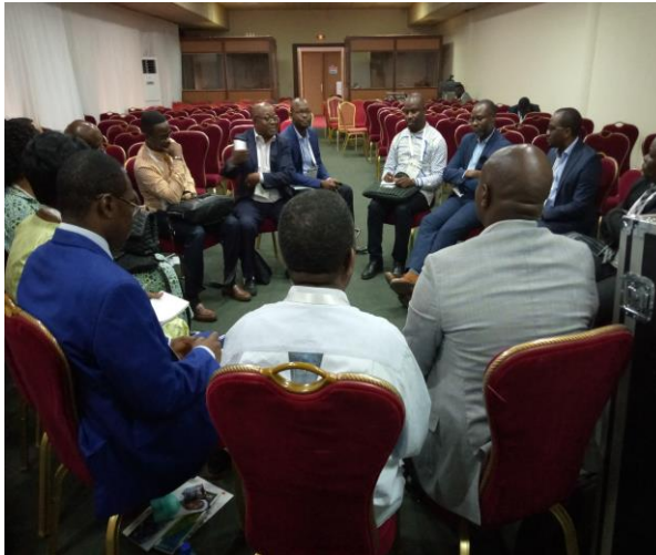
Photo 1: Concertation des acteurs Congolais du secteur lors de la SAM 2019 au Burkina

Le Secrétariat Général à l'Agriculture a organisé un atelier pour montrer le mode opératoire d'un projet d'appui aux jeunes agriculteurs (Projet PEJAB). Les fonds de ce projet devraient passer par le FPM.