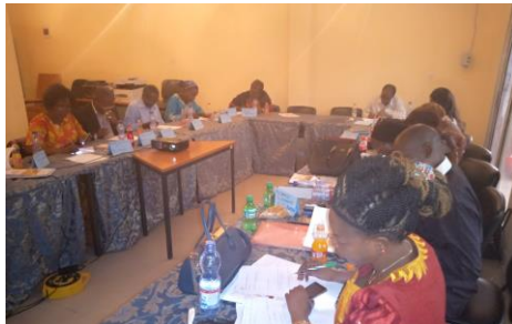
Photo 2 . Séance d'éducation financière des dirigeants des COOPEC à Kinshasa

Des dirigeants des COOPEC de Kinshasa ont suivi la formation sur les quatre modules d'éducation financière. La formation s'est étalée sur un mois soit un module chaque samedi. Le module de budgétisation, d'épargne, de crédit et de négociation financière ont été déroulés. Il s'agit essentiellement des dirigeants de la COOPEC BOMOKO, COOPE CEAC MATETE, COOPEC UNION ET CHARITE. Vingt personnes ont bénéficié de cette formation dont neuf femmes.